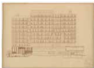
Fasadritning, St Görans Gymnasium.