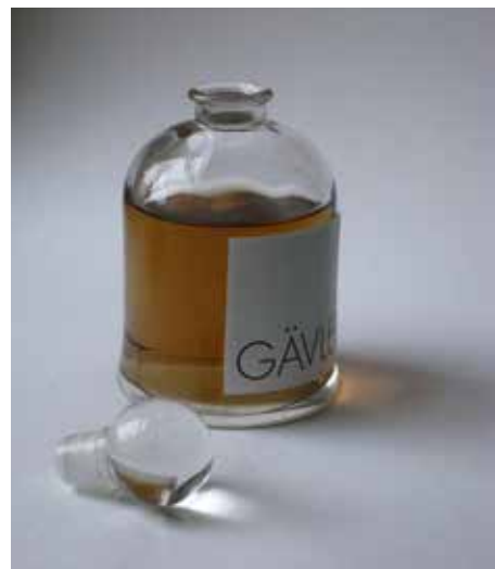
Natt i Gävle, 1967. Foto Svante Hedin; "Gävle Smell Map"; prototyp av doftkarta utställd i samband med föreläsning om projektet på KTH-A; Konceptbild, doften av Gävle, Arkitektens Grannar.

Projektets första fallstudie utfördes i den gamla industristaden Gävle, vars gatumiljö under lång tid präglats av att ligga i "skuggan" av en uppsättning lokala lukter, som dessutom varierade med vindriktningen: det kaffeosande Gevalia-rosteriet, Ahlgrens-fabrikens godislukt, Östersjöhamnens havsbris och svavelstanken från pappersbruket i Skutskär. De historiska dofterna som dominerat Gävles stadsmiljö kartlades genom researcharbete och en doftvandring, och presenterades sedan i form av en doftbaserad "karta" i utställningsform. Doftkartan kompletterades med historiska fotografier från dessa verksamheter, i huvudsak hämtade från Läns museet Gävleborgs digitala arkiv. När doft beskrivs med ord eller bild så framkommer det tydligt hur svårt det är att översätta luktsinnet till andra media – även rumsliga sådana, som i utställningsformatet.