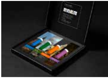
Doftlåda och digital rundtur för utställningen "Fleeting – Scents in Colour".

lukten som samhälls- och kulturfenomen. I Sverige har samtidigt parfym- och doftmakare som Byredo, Stora Skuggan och Uniform både etablerat sig och stundtals intresserat sig för hur platser och rum, i mer generella termer, bidrar till doftupplevelser och doft-minnen.