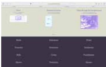
Skärmdump av forskningsprojektet Odeuropas digitala doftencyklopedi.

Dofter har producerats för att mer indirekt beskriva en byggnad, så som de parfymerna som säljs på New Museum i New York,