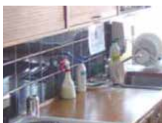
Arkivbilder, vardagsliv från 1960-90-tal på St Görans Gymnasium.