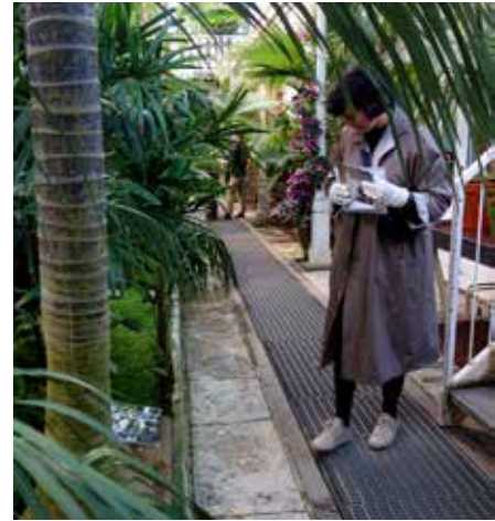
"Second Nature", Göteborgs internationella konstbiennial, GIBCA, 2021. Plastficka med besökarnas "rekvisita" i form av doftprov och audioguide.

Fallstudie nummer två gjordes i Palmhuset i Trädgårdsföreningen i Göteborg, där arvet av Ostindiska Kompaniets botanisk-koloniala import och 1800-talets industrialiserade glas- och gjutjärnsarkitektur skapat ett dofttrum präglat av lika delar virrvarr av tropiska växter och artificiellt reglerat inomhusklimat. Delprojektet, som fick namnet Second Nature , genomfördes i samarbete med Göteborgs internationella konstbiennial. Palmhusets iscensatta "djungel" överlagrades med syntetiska och förstärkande tropiska dofter som en av form av rekvisita som publiken fick bära med sig i en rundvandring, ledd av en audioguide.