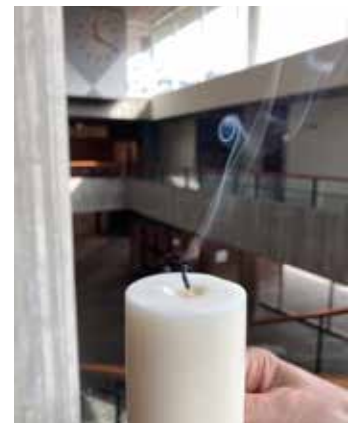
Rundvandring på St Görans gymnasium; Syntetisk doftscenografi i form av ett levande ljus.

Den tredje fallstudien var före detta St Görans Gymnasium (idag ombyggt till bostäder), som fortfarande visuellt karaktäriseras av uttrycksfull modernistisk betong – men som förlorat dofterna som förknippades med dess ursprungliga användning, som yrkesskola för unga kvinnor. Under 60-talet undervisades studenter i matlagning, sömnad och att ta hand om ett "hem". De sålde bakverk i en butikslokal mot gatan och hade idrottslektion på taket. Arkitekturen präglades en gång av de städprodukter som användes i lokalerna, tidens populära ungdomsparfumer, gymnastikhallens svettluft, trädetaljerna i interiören och de vävda textilierna.